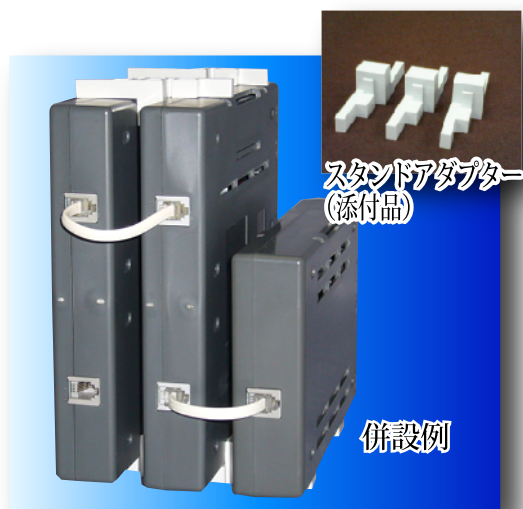
スタンドアダプター (添付品)